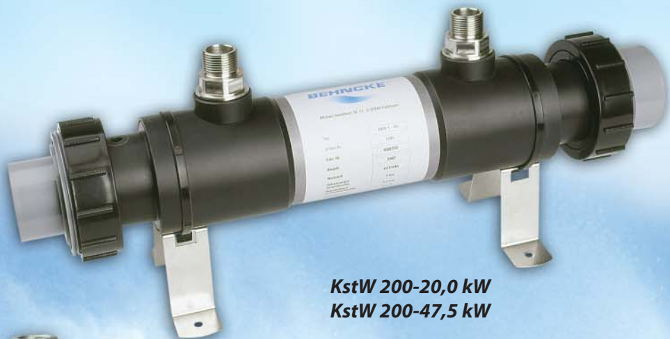
KstW 200-20,0 kW KstW 200-47,5 kW