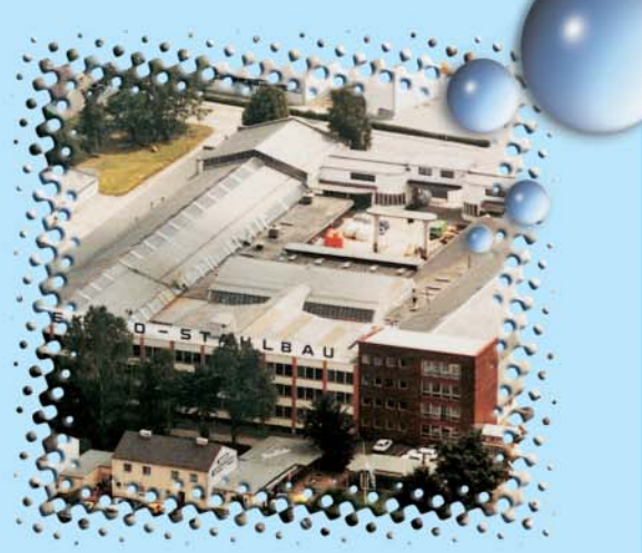
Fertigungsbetrieb in Putzbrunn bei München