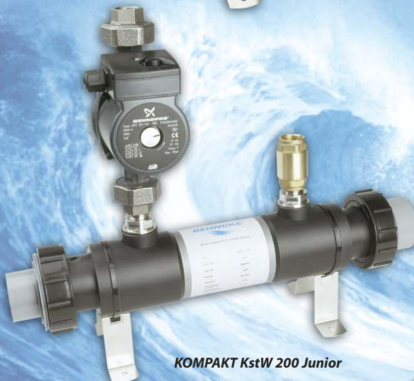
KOMPAKT KstW 200 Junior