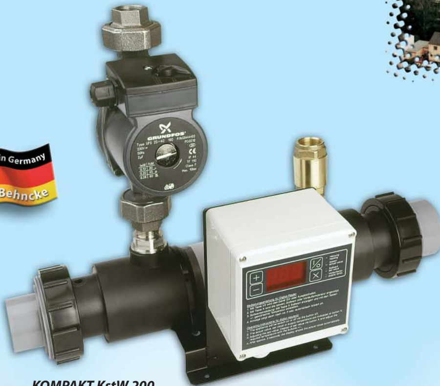
KOMPAKT KstW 200 Wärmeblock

Bei Ausführungen mit Ringwellschlauchwendel Material V4A (1.4571) max. Chloridkonzentration bis 400 mg/l bei Chloridkonzentration über 400 mg/l mit meerwasserbeständigem Material lieferbar, Anschlüsse wasserseitig mit Kst.-Verschraubungen.